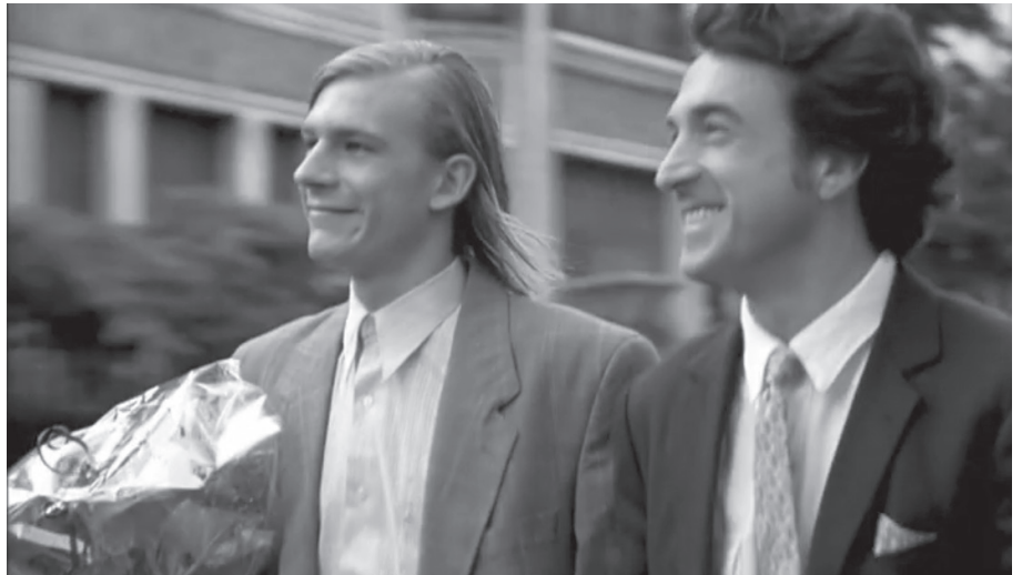
Les Apprentis : La ballade des gens à moitié heureux

Ils commencent en partageant un appartement, pour aller ensuite voler de l'argent, passer par la séparation et finir en rigolant. Que des péripéties racontées sur le ton de la plaisanterie. Mais même si ce film nous fait bien marrer, il y a des passages touchants concernant l'amitié des protagonistes. L'histoire nous fait prendre conscience de l'importance d'avoir un-e ami-e, spécialement dans les moments difficiles, car la vie est toujours plus belle à deux. C'est donc