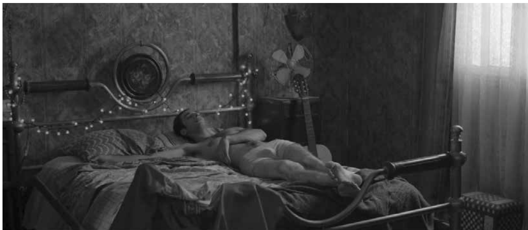
Firas Khouri vient présenter son superbe long métrage Alam , lundi, 18h15 au Cratère

Taner, étudiant palestinien en Israël, s'installe dans la maison familiale inoccupée à quelques pas de celle de ses parents. Papier peint vert forêt, dorures dans tous les coins et une pendule qui n'indique que les secondes... Soit l'endroit parfait pour s'émanciper, libéré de la peur de son père.