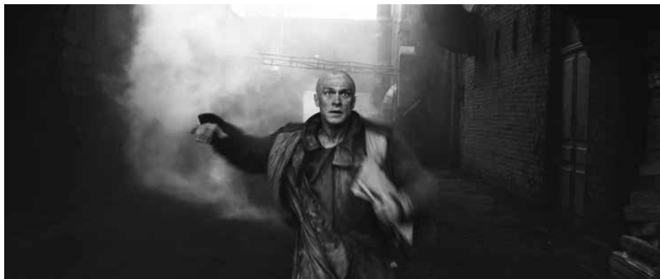
Sauver son âme, à défaut de sauver sa vie...

Plongez dans la terreur Stalinienne de 1938 en compagnie du Capitaine Volkonogov, un soldat de la NKVD*.