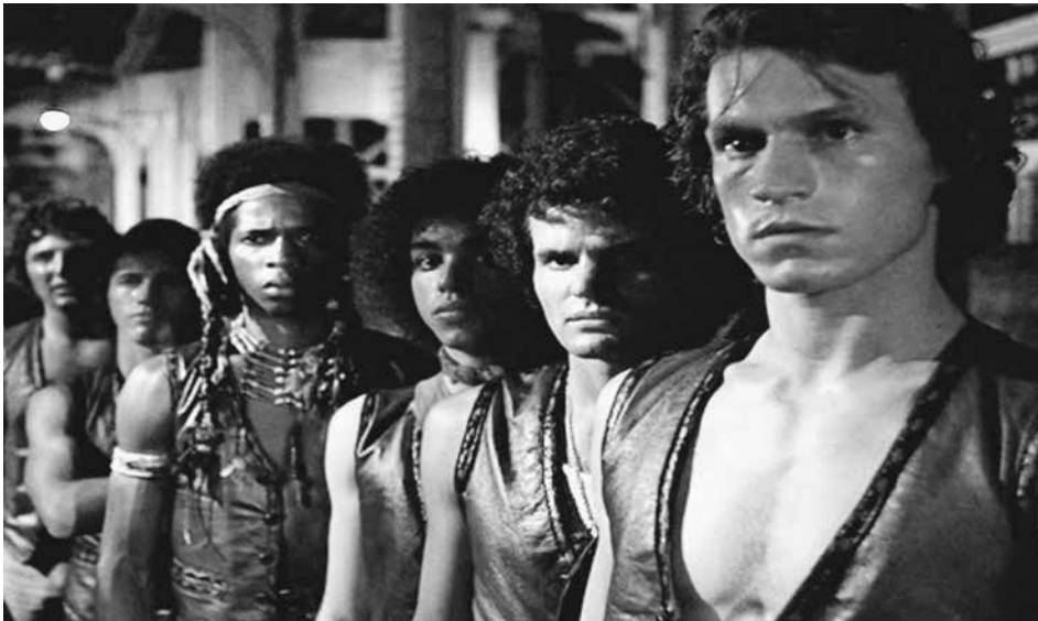
Lundi à 21h au Cratère, les Warriors sont pas contents !