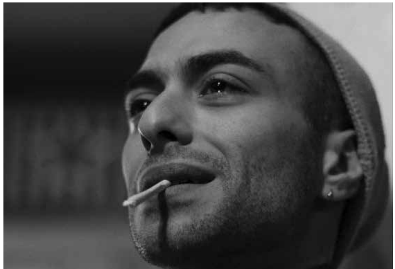
Parmi les courts de l'année, une Palme d'or !

Quant à l'Agence du court métrage, qui s'attelle à développer la diffusion de ces films en France, elle a servi d'intermédiaire entre les 960 cinéastes postulant cette année et la compétition de courts. Palmarès ce soir à 18h, juste avant l'avant-première de Disco Boy . L'Agence fête cette année ses 40 ans et