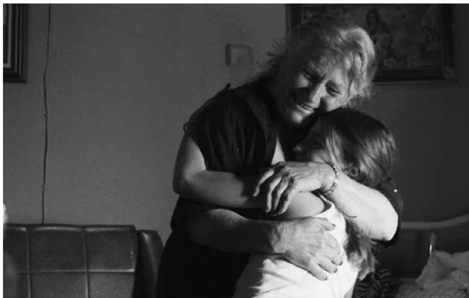
Alma Viva , entre fractures et réunion de familles

Une famille unie par les chants des prières et la sagesse. Des moments de bonheur qui raniment la saveur de la vie. Puis du jour au lendemain tout bascule.