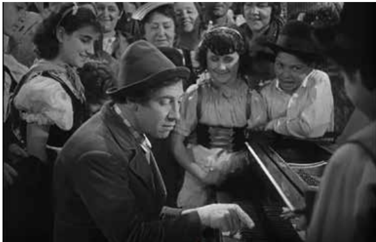
Les Marx Brothers : un doigt de génie !