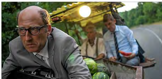
■ La délirante comédie "King of the Belgians" au programme de la soirée d'ouverture.

Avec quasiment cent films en vingt ans, Olivier Gourmet est