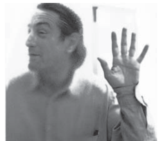
Signatures Xavier Lambours